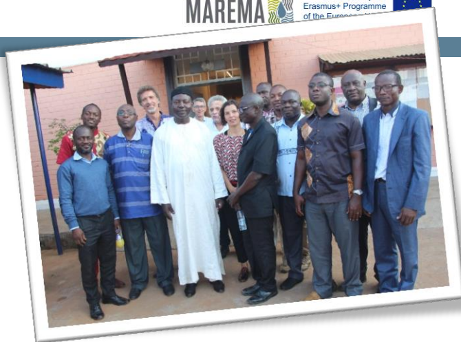
Participants à la formation sur les outils innovants, Yaoundé (Cameroun)

C'est le nombre total de partenaires du projet : 5 partenaires porteurs, bénéficiaires directs, et 6 partenaires d'appui en Europe pour les accompagner.